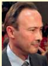
Bruno Valkeniers Vlaams Belang-voorzitter

“Een kordate aanpak van de criminaliteit blijft uit. Tot ergernis van de rechters, tot frustratie van de politie, tot onvrede van de samenleving en tot groot jolijt van de criminelen.